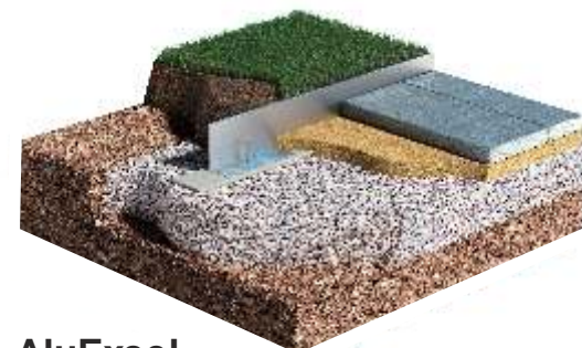
AluExcel Platten Belag - Rasen